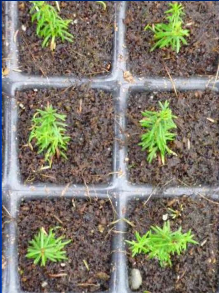
Substrát s Cocopeat