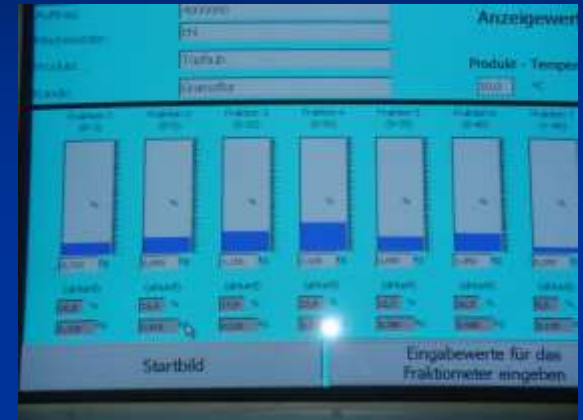
Fraktimetr - kontrola struktury