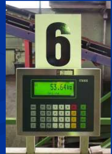
Přesné dávkování hnojiv