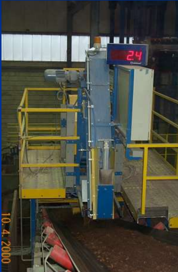
Volumat – kontrola objemu