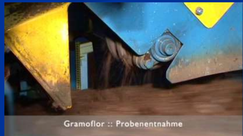
Odběr reprezentativního vzorku