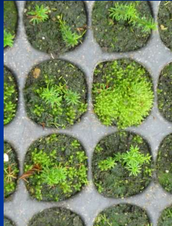
100% bílá rašelina